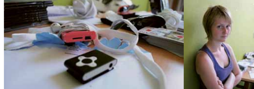
Hetty Goedvolk directeur Stichting JJC

'De jongeren hebben allemaal een eigen verhaal. Een verhaal waarom het niet gelopen is zoals ze willen, of zoals zou moeten'